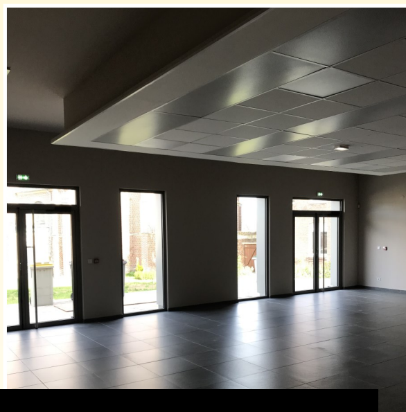
L'ancienne salle annexe affiche une belle modernité.