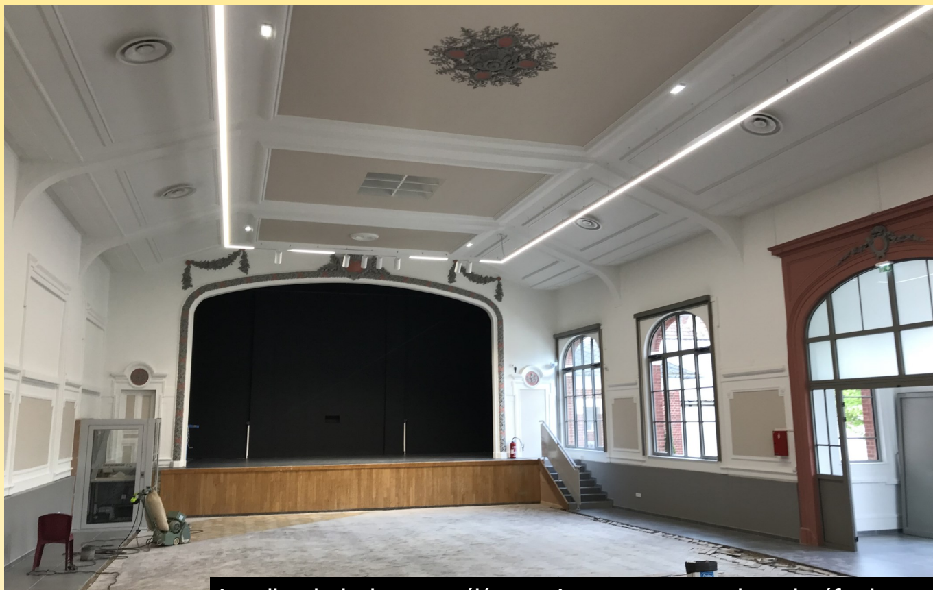
La salle principale se veut élégante. Le parquet est en phase de réfection. Des travaux de peinture sont toujours en cours.