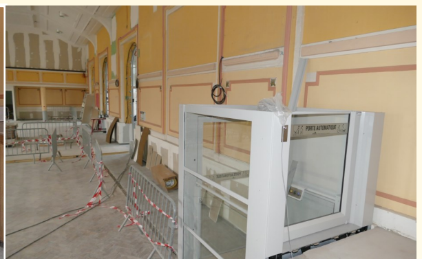
Une plateforme élévatrice permettra aux personnes à mobilité réduite d'accéder à la scène.