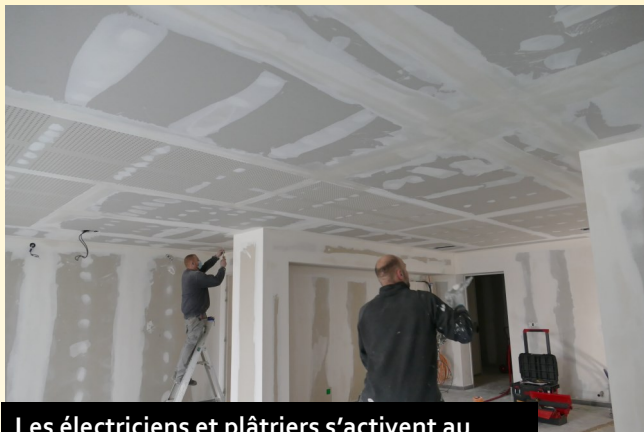
Les électriciens et plâtriers s'activent au niveau du futur bar.

La salle des fêtes continue ainsi sa mue afin de se projeter vers l'avenir, sans négliger son patrimoine et son histoire.