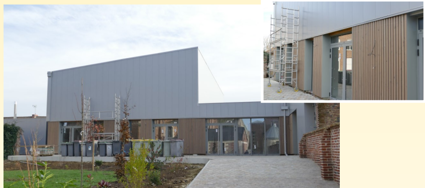
À l'arrière du bâtiment, le pavage et le bardage sont en cours de finition.