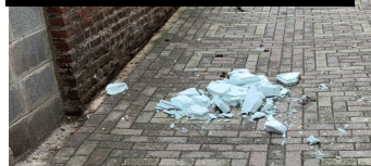
Passage Émile Zola - Août 2020

Nous tenions à pointer fermement du doigt ces comportements inacceptables qui engendrent non seulement des problèmes d'hygiène et de propreté dans un contexte sanitaire déjà particulièrement fragile, mais induisent aussi des coûts de traitement supplémentaires non négligeables pour la commune et donc les contribuables.