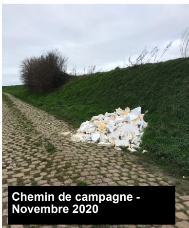
Chemin de campagne - Novembre 2020