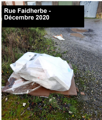
Rue Faidherbe - Décembre 2020

Peut-on accepter qu'une petite minorité de personnes considèrent que le civisme et le respect des autres ne les concernent pas ? En effet, les dépôts sauvages relèvent d'une incivilité caractérisée alors que de nombreuses solutions existent pour faciliter la gestion des déchets.