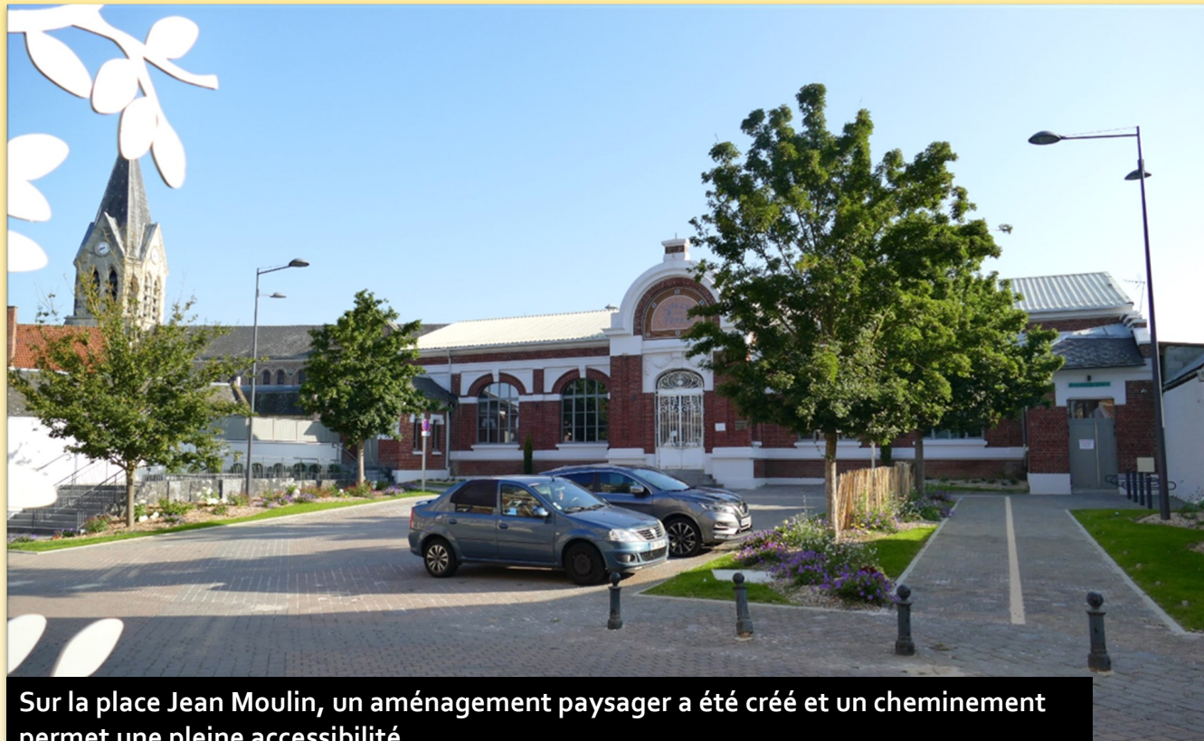
Sur la place Jean Moulin, un aménagement paysager a été créé et un cheminement permet une pleine accessibilité.

Bois, acier, cuivre... Après la Covid-19, c'est aujourd'hui la pénurie mondiale de matières premières qui retarde les chantiers de construction. Cette pénurie se répercute inévitablement jusque sur le chantier de la salle des fêtes. Pour autant et malgré ces retards, les travaux continuent. Encore un peu de patience pour découvrir la salle des fêtes dans ses nouveaux habits.