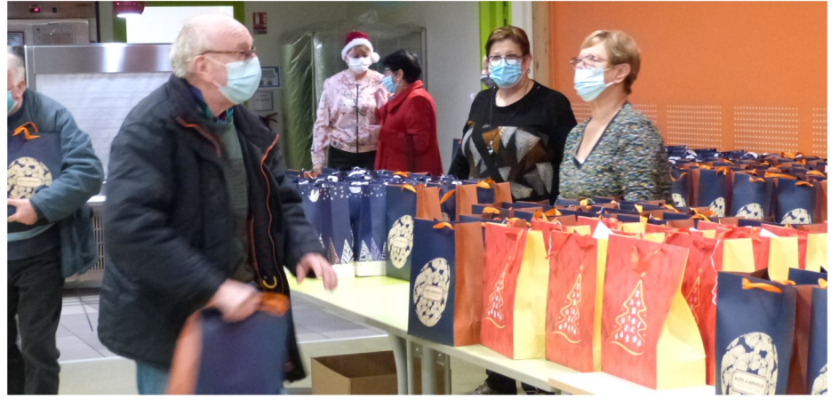
Les bénéficiaires du C.C.A.S, les aînés et les résidents du Bois d'Avesnes ont apprécié les présents offerts par la Municipalité.