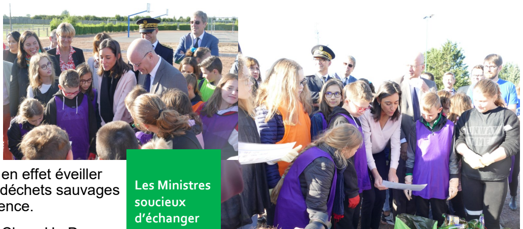
Les Ministres soucieux d'échanger avec les collégiens

Il s'agit de s'en inspirer car en effet, si beaucoup a été fait, beaucoup reste à faire.