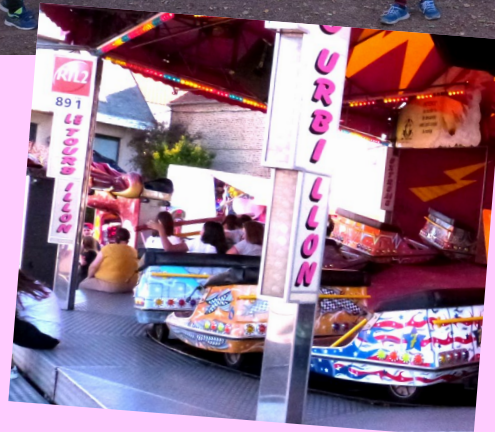
Fête communale : Le plein d'animations pour la ducasse de septembre avec notamment la brocante, le concours de billon et le jeu d'adresse à la pétanque.