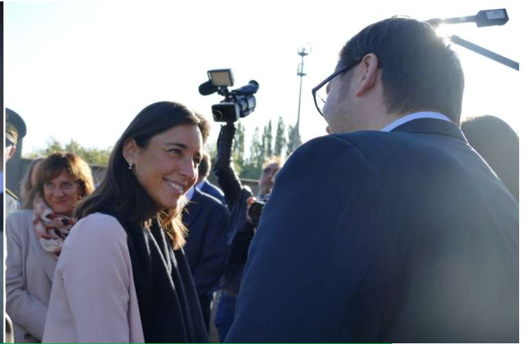
L'arrivée des Ministres

En matière d'écologie, le Collège fait valeur d'exemple.