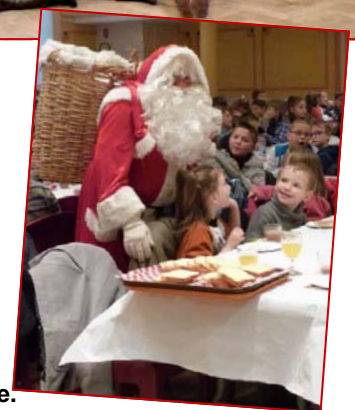
Le Noël des élèves des écoles Danielle Casanova et Joliot-Curie.