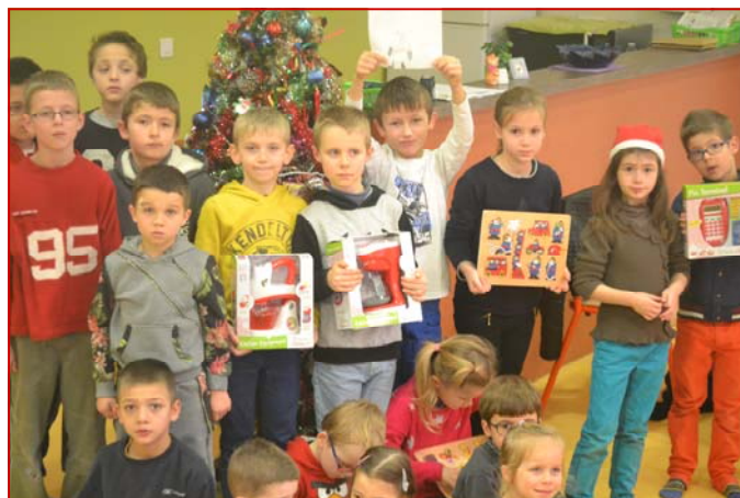
Le Noël des enfants inscrits à l'accueil périscolaire.