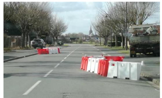
Suppression des chicanes de la rue du 19 mars 1962. Après plusieurs mois d'expérience, la municipalité a jugé opportun, en accord avec les riverains, d'enlever les chicanes provisoires qui avaient été installées dans la rue du 19 mars 1962.