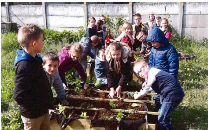
Les enfants ont la main verte. Les élèves de M me Pottier de l'école primaire ont participé à des ateliers de mise en culture de fleurs et légumes. Il s'agissait de les sensibiliser à une certaine démarche écologique.