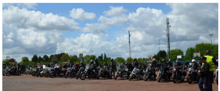
Run Customs des MORS. Le 4 mai dernier, la randonnée moto des MORS s'est déroulée dans des conditions optimales malgré une météo capricieuse. Le succès fut au rendez-vous ! Les MORS remercient tous les participants.

Pour autant, l'idée était surtout de mieux sécuriser les abords de la mairie notamment mais aussi de faciliter l'entretien de bacs devenus vétustes. Notons que l'idée a fait des émules dans le Cambrésis puisqu'à cette suite des communes et commerçants ont contacté l'artisan qui a réalisé les arbres.