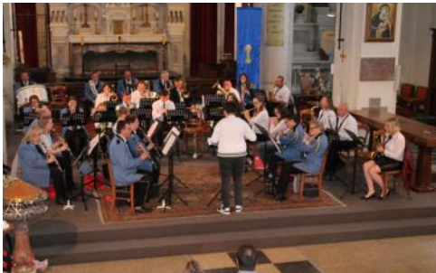
Concert de l'Harmonie. Le 12 mai dernier, les musiciens de l'Harmonie ont donné un concert gratuit à l'église pour le plus grand plaisir des amateurs de musique.