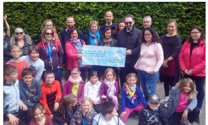
École Joliot-Curie. Grâce aux nombreuses actions menées par une équipe dynamique et bénévole, l'Association des Parents d'Elèves a remis un chèque de 3 675€ à l'école Joliot-Curie. Cela permettra de soutenir fortement les sorties pédagogiques de fin d'année. C'est une aide de 15€ par élève permettant d'alléger le coût total des voyages prévus au Moulin de la Tourelle d'Achicourt, à Cité Nature à Arras, au Palais de Compiègne, au musée Arkéos de Douai et à la maison des géants à Ath en Belgique.