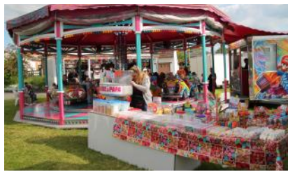
Alamo. La fête foraine Alamo des 11, 12, 13 et 14 mai derniers a réjoui les plus jeunes.