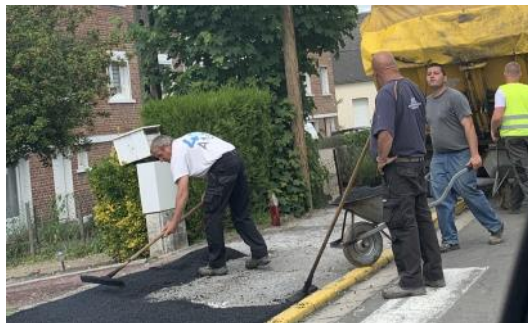
Rue Sadi Carnot. Après la purge d'une partie des trottoirs côté pair, la réfection de certaines portions des trottoirs coté impair de la rue Sadi Carnot, ont débuté le 20 mai dernier.