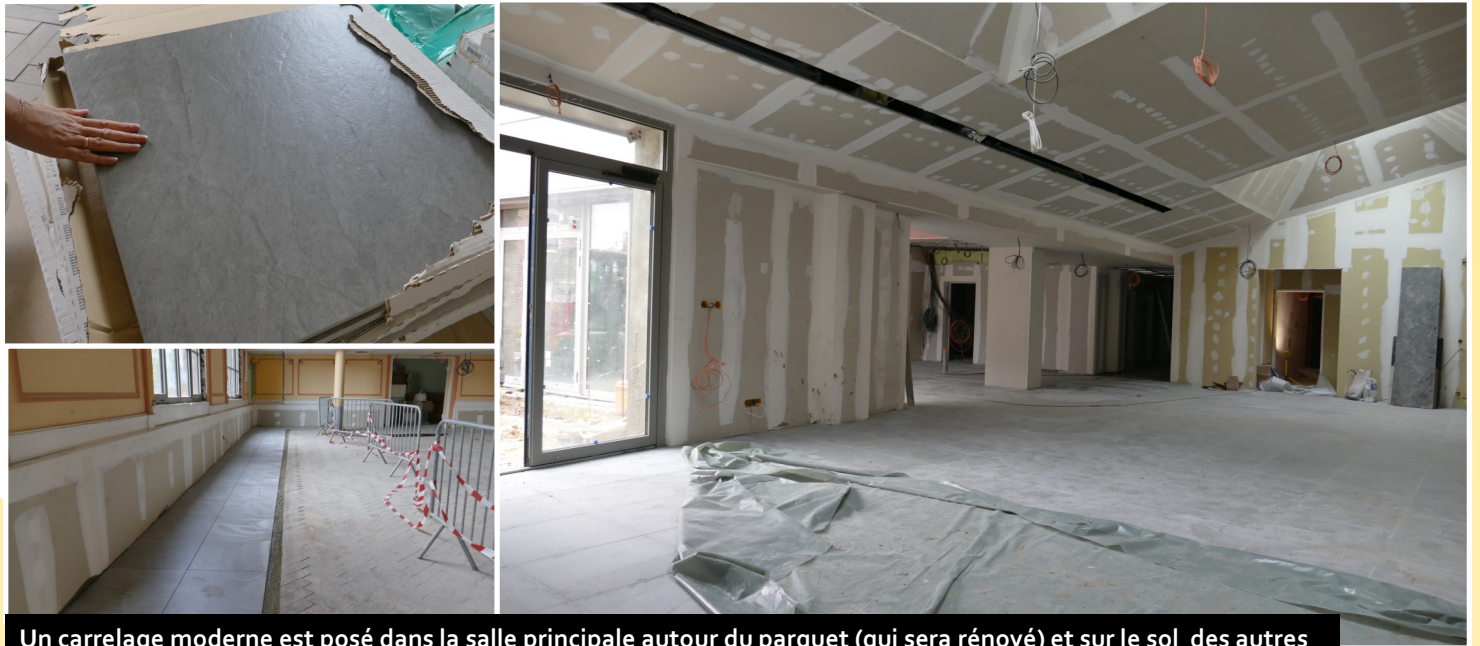
Un carrelage moderne est posé dans la salle principale autour du parquet (qui sera rénové) et sur le sol des autres salles.