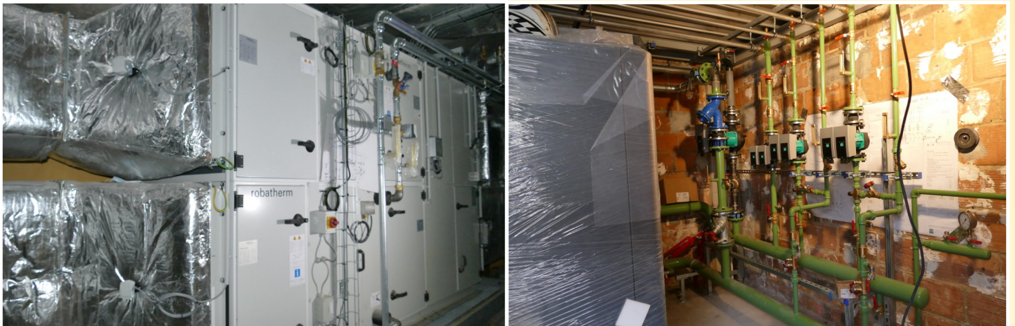
Les installations de chauffage et de soufflerie sont impressionnantes.