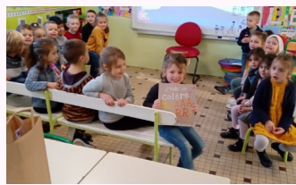
Un livre et des gourmandises ont été remis à chaque enfant de l'école maternelle Danielle Casanova.