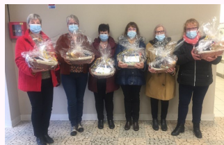
Des corbeilles remplies de produits gourmands destinée aux bénéficiaires du CCAS ont été délivrés par les bénévoles.