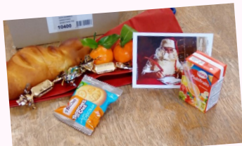
Les enfants de l'école élémentaire Joliot-Curie ont reçu un sachet rempli de gourmandises.

Malgré la situation sanitaire, la municipalité a célébré les fêtes de fin d'année en essayant d'y mettre le plus de chaleur possible. Pour perpétuer cette tradition, elle a offert des bons d'achat aux aînés, des présents aux enfants des deux écoles (malheureusement au regard de la Covid-19, le Père Noël n'a pu être présent cette année), aux bénéficiaires du CCAS et aux résidents du Bois d'Avesnes. Le tout en respectant bien évidemment les mesures de distanciation et les gestes barrières qui s'imposent.