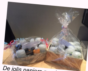
De jolis paniers garnis de nécessaires de toilette ont été offerts aux résidents du bois d'Avesnes.