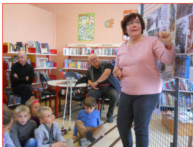
Les enfants de l'école Joliot-Curie intéressés par l'exposition sur le Centenaire 14-18 à la bibliothèque.