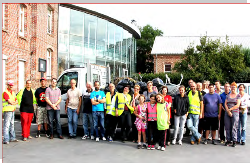
Grand nettoyage d'automne pour rendre notre ville plus accueillante. Merci aux participants qui ont rempli un camion de débris en tout genre. La propreté en ville, c'est l'affaire de tous. En effet, elle se poserait en d'autres termes s'il n'y avait pas de déchets jetés au sol. Des déchets jetés parfois même aux abords des poubelles disposées en ville.

Si chacun fait un effort et œuvre de citoyenneté, c'est tout le monde qui y gagnera !