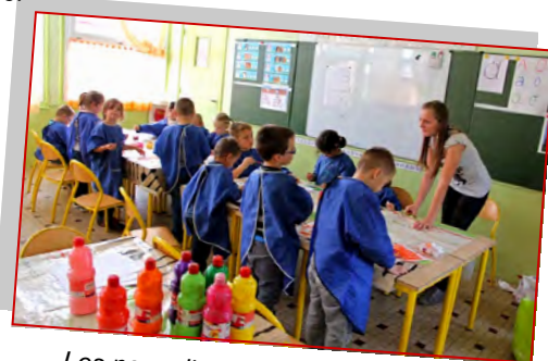
Les nouvelles activités périscolaires du vendredi après-midi sont riches et variées.

Si chacun fait un effort et œuvre de citoyenneté, c'est tout le monde qui y gagnera !