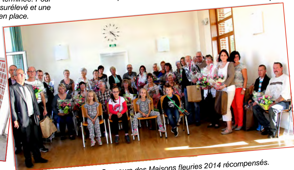
Les participants au Concours des Maisons fleuries 2014 récompensés. Félicitations à tous !