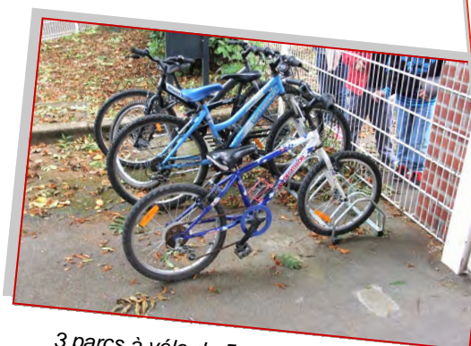
3 parcs à vélo de 5 places chacun sont installés à l'école Joliot-Curie pour permettre aux enfants venant à vélo de les disposer en toute sécurité.