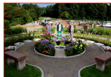
Les travaux du jardin du souvenir se terminent.