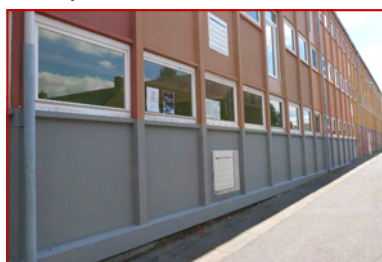
L'école Joliot-Curie arbore une nouvelle peinture.

C'est ainsi que les services municipaux ont effectué de nombreux travaux de démolition, de peinture et de nettoyage dans les deux écoles et dans les salles communales, d'aménagement au cimetière autour du jardin du souvenir, pour ne prendre que ces quelques exemples.