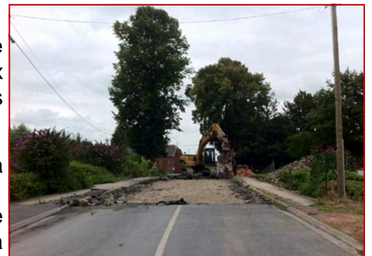
La démolition du Pont.

Nous rappelons que le montant total des travaux s'élève à 830 000 € pris en charge par le Conseil général et NOREADE. Enfin, et comme nous l'avons signalé dans La Vie Avesnoise précédente, la municipalité monte les dossiers nécessaires à l'enfouissement des réseaux comme il en a été, lors des deux premières phases. Les travaux devraient avoir lieu en 2015.