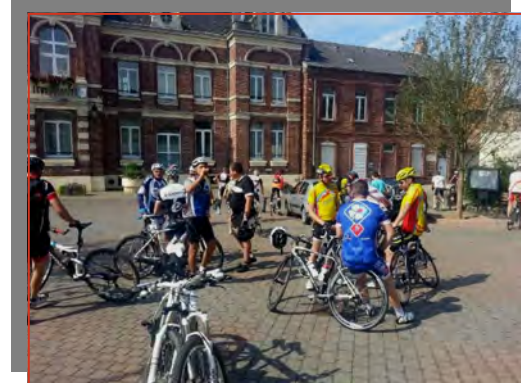
La randonnée organisée par Avesnes Cyclospor et qui a accueilli près de 450 participants !!!