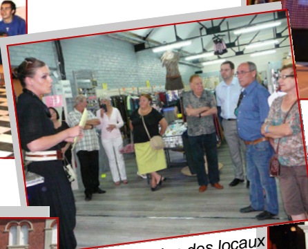
Inauguration des locaux "Les Fées Relais".