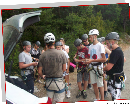
Les ados avesnois découvrent l'escalade aux Gorges du Verdon dans le Var.