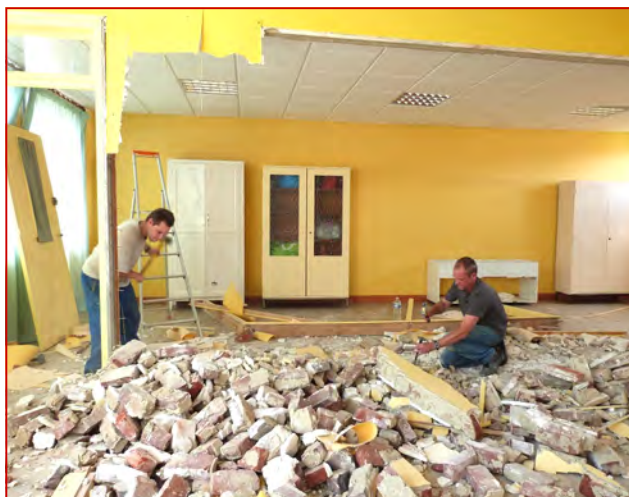
Agrandissement d'une classe à l'école maternelle à la demande des enseignants et pour le confort des enfants.

Comme chaque été et en supplément des travaux quotidiens, la municipalité profite de la période des vacances pour effectuer de gros travaux de rénovation et de sécurisation ; le tout, avec un effectif restreint compte-tenu des congés annuels.