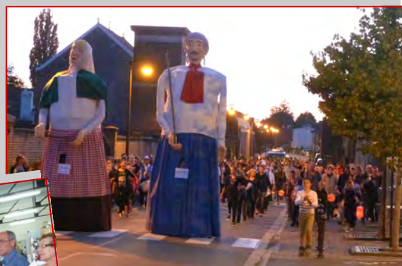
La retraite aux flambeaux du 13 Juillet 2014.