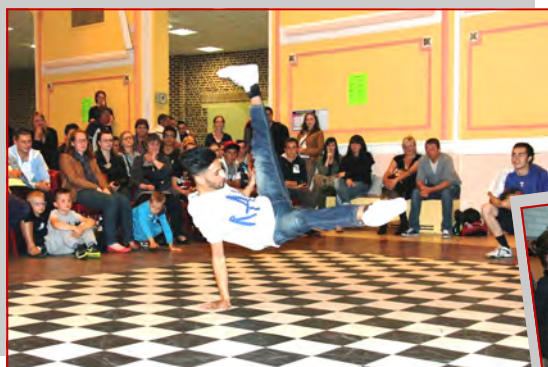
Un battle sensationnel organisé par l'association Fraternity Dance.