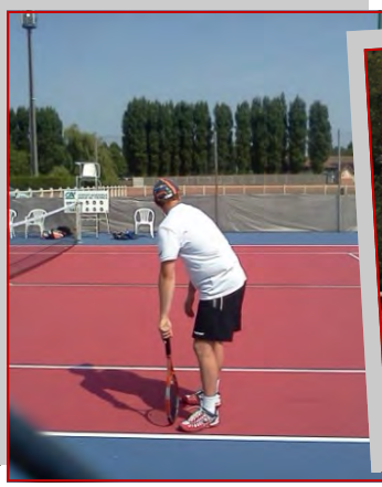
Le tournoi du Tennis Club.