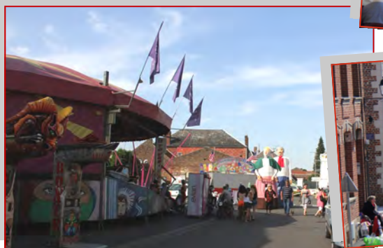
Une ducasse animée avec ses manèges, le traditionnel concert du Groupe Arpège et de l'Harmonie Batterie, et le vide-grenier de l'association Y s'ront toudis là.