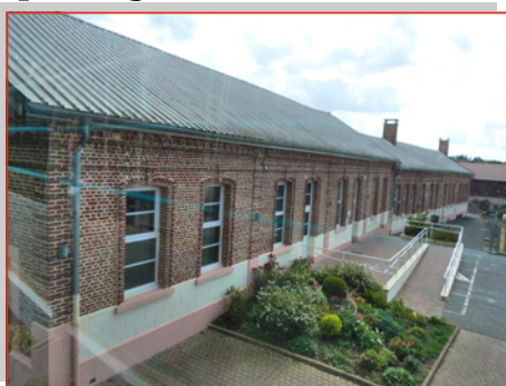
Le bâtiment de la future structure multi accueil.

Dans le cadre de sa compétence « petite enfance », la Communauté de Communes du Caudrésis-Catésis avait mandaté une étude sur les modes de garde de jeunes enfants sur le territoire.