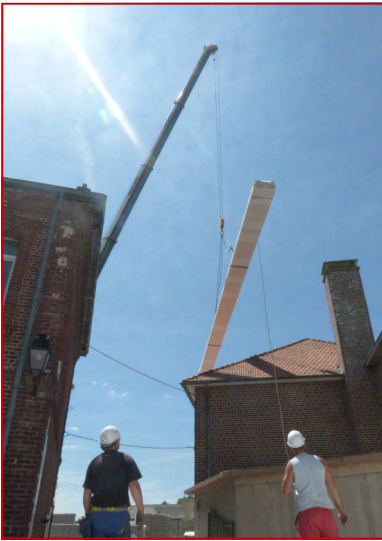
Dispositif impressionnant pour la livraison de la charpente en juin dernier.

Les travaux de gros œuvre du restaurant scolaire sont pratiquement finis.