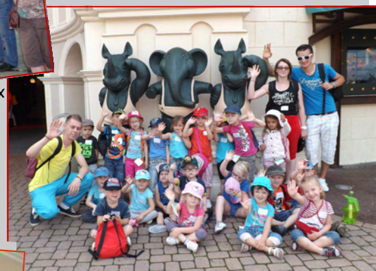
L'accueil de loisirs avec notamment une belle journée au Parc Astérix et une fête ayant pour thème le cinéma.