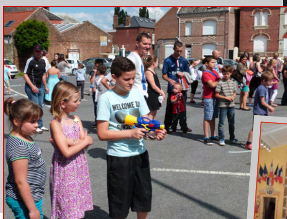
Des jeux populaires qui ont fait la joie des petits comme des grands.