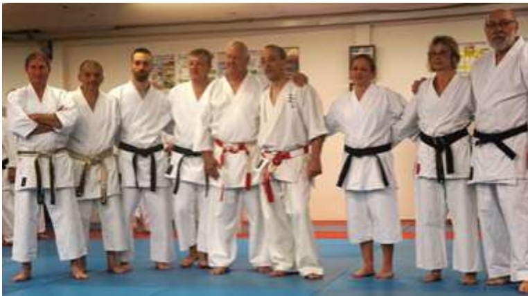
Les enseignants du KCA : anciens et actuels.