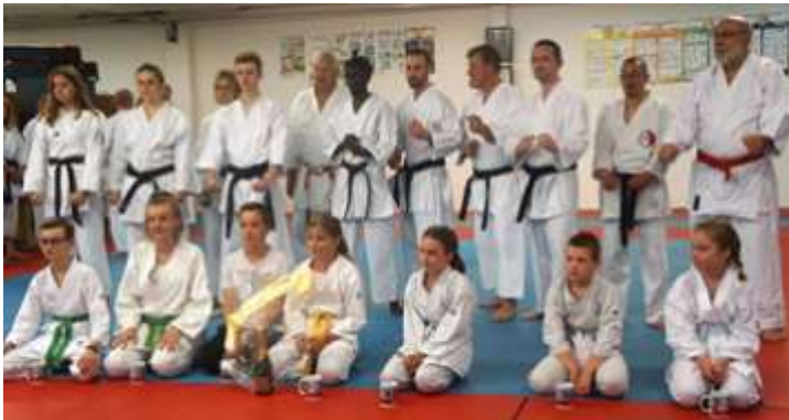
La relève était également présente avec les enfants du club qui ont reçu un mug souvenir des 50 ans du KCA.