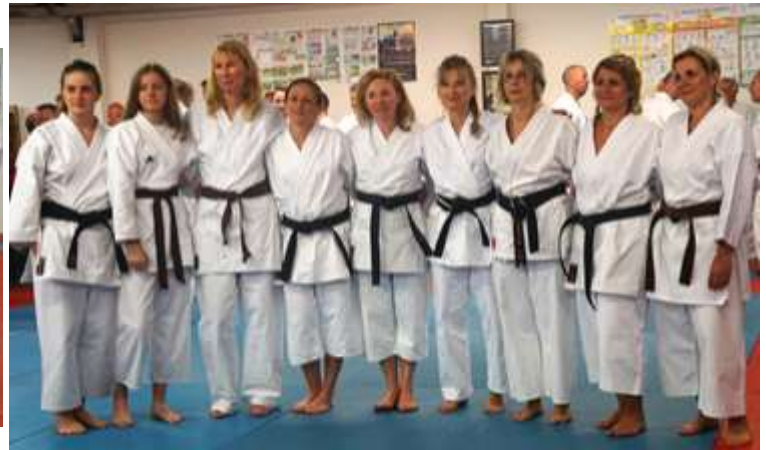
Les dames à l'honneur, elles ont toutes été championnes du Nord ou Régionales (combat ou kata) et trois d'entre elles ont été sacrées Championnes de France.