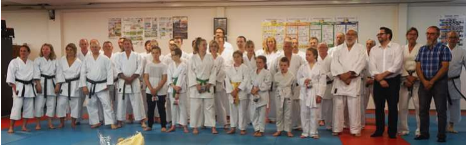
Tous réunis sur le tatami pour les 50 ans du KCA. De nombreuses ceintures noires formées depuis plusieurs décennies étaient présentes et cette rencontre a donné lieu à de beaux moments d'émotions.

Retour en images sur ce 50 ème anniversaire.