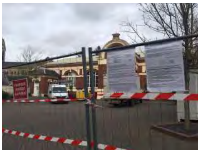
Salle des fêtes. Les travaux de désamiantage sont en cours de réalisation. Les travaux de réhabilitation interviendront ensuite.