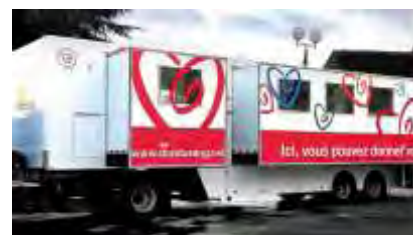
Don du Sang. Le 14 janvier dernier, 54 volontaires ont participé au don du sang organisé par l'Établissement Français du Sang et la municipalité. Nous les remercions.