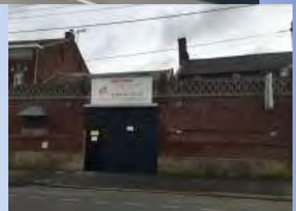
Les friches SFM et France Menuiserie Confort devraient être démolies dans les prochains mois.