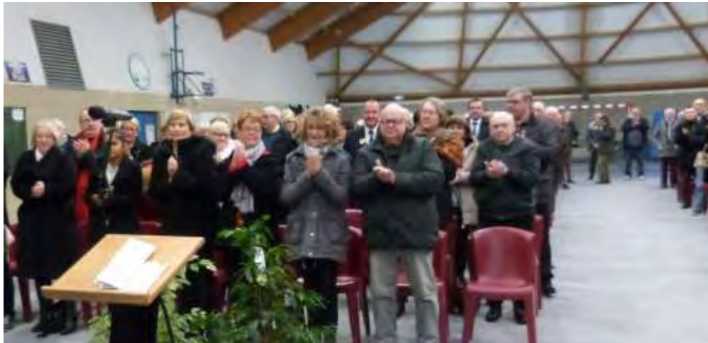
Vue d'une partie de l'assistance.