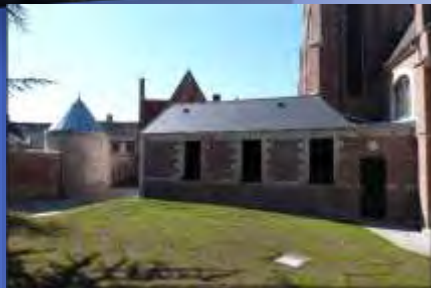
La sacristie et la tourelle réhabilitées