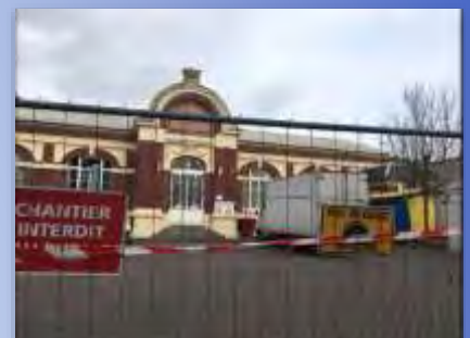
Les travaux de réhabilitation de la salle des fêtes sont lancés.