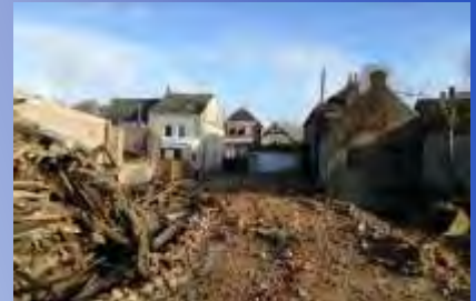
Désamiantage et démolition de l'ancienne ferme Guidez dans la rue Sadi Carnot.