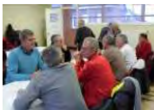
Pétanque. Moment sympathique pour les Pétanqueux Avesnois, qui ont respecté la tradition de la galette des rois le 14 janvier dernier.