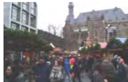
A.P.E. 50 personnes ont passé une agréable journée aux marchés de Noël d'Aix la Chapelle et de Monschau en Allemagne. Cette sortie était proposée le 15 décembre dernier par l'Association des Parents d'Élèves des écoles primaire et maternelle.