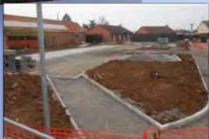
Démolition de la maison à l'angle des rues Barbusse et Péri pour y construire un parking paysager.

En raison des travaux de la salle des fêtes, la cérémonie des vœux de la Municipalité s'est déroulée à la Halle des sports du collège Paul Langevin le 6 janvier dernier devant une assistance nombreuse. Tour d'horizon, non exhaustif, de ce qui y a été énoncé.