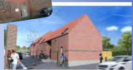
La construction de logements par Promocil à l'emplacement de l'ancienne ferme Delalande.