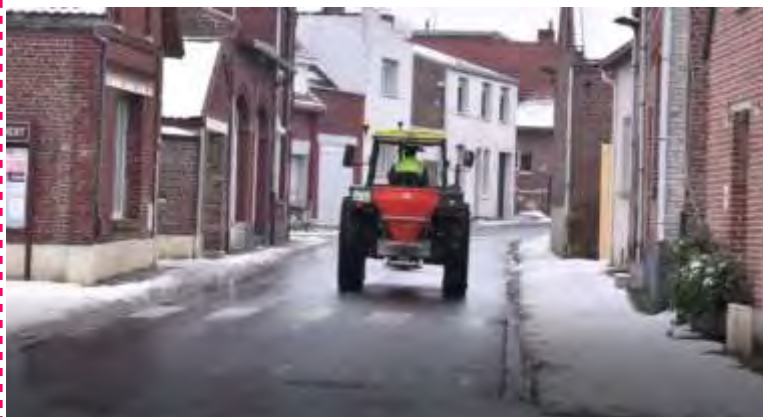
Épisodes neigeux des derniers jours. Nous tenions à remercier les agents techniques municipaux et ceux d'ACTION, qui ont déneigé et salé les axes de notre commune durant ces intempéries.