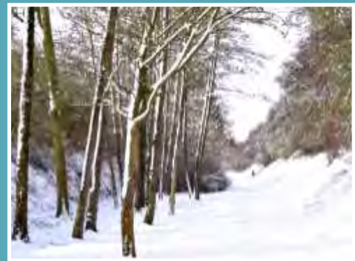
Ces magnifiques photos ont été réalisées bénévolement par M. Patrick Turotte. Nous le remercions chaleureusement.