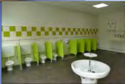
La réfection des toilettes de l'école maternelle