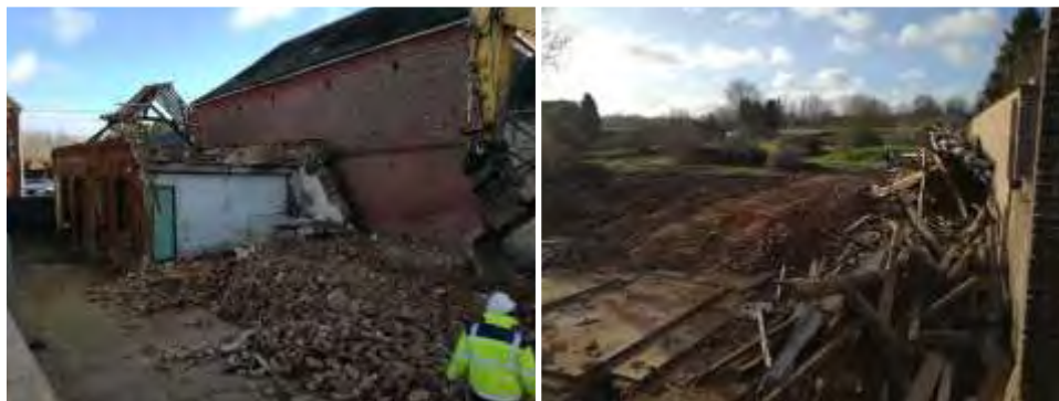
Friche de l'ancienne ferme Guidez dans la rue Sadi Carnot. Après le désamiantage, les travaux de démolition.