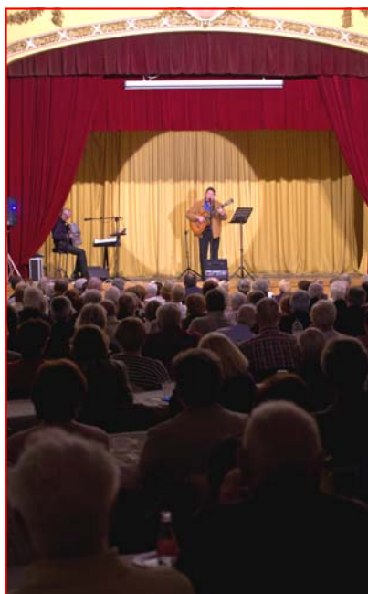
Le 8 novembre dernier, plus de 300 personnes ont assisté au fabuleux concert de Bruno Brel, digne héritier de son oncle Jacques. La 1 ère partie fut majestueusement assurée par les choristes du groupe Arpège.