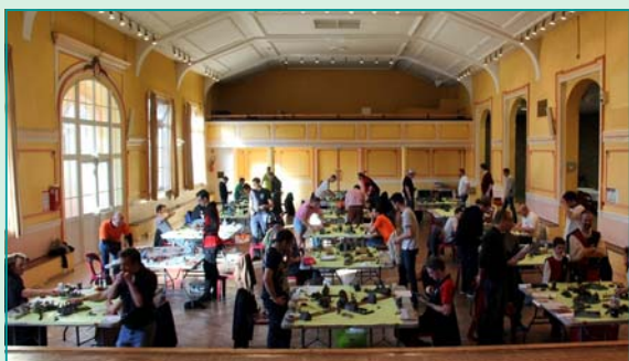
Le 1er novembre dernier, l'OST avesnois organisait son premier tournoi « King of War », wargame de table dans lequel des « armées » de figurines de 28mm s'affrontent.