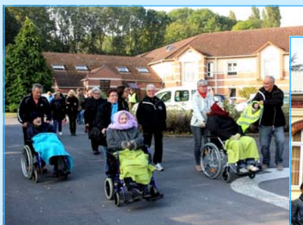
Journée bleue des Godillots Avesnois durant laquelle nos Godillots ont promené les résidents du Bois d'Avesnes au cœur de notre ville.