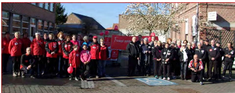
Parcours du Cœur : plusieurs dizaines de personnes se sont retrouvées pour la bonne cause.