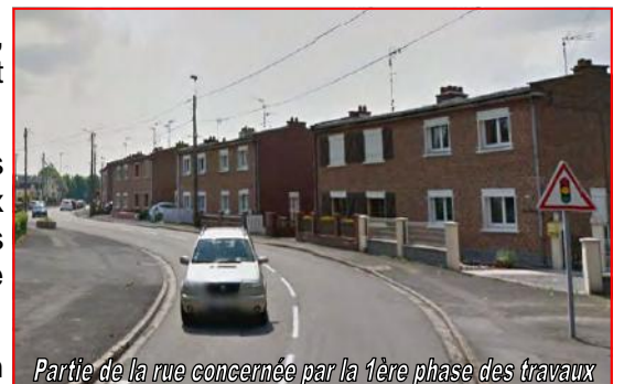
Partie de la rue concernée par la 1ère phase des travaux

Enfin, nous comptons sur la compréhension, la patience et la responsabilité de chacun pour que les travaux se déroulent dans les meilleures conditions.