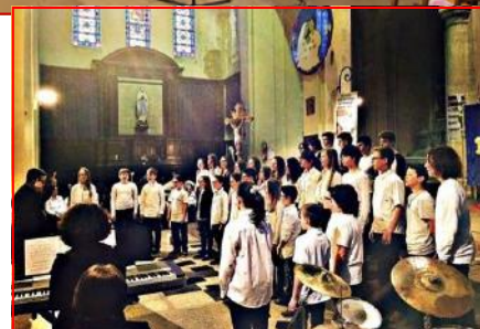
Les prestations des chœurs (des enfants du samedi et des adultes le dimanche) ont ravi le public présent à l'occasion du week-end chantant organisé par Arpège en l'église Saint-Rémi.