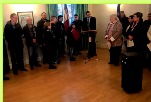
Défilé, dépôt de gerbes et discours à l'occasion de la Journée Nationale du Souvenir des victimes et des héros de la Déportation le 25 avril dernier.