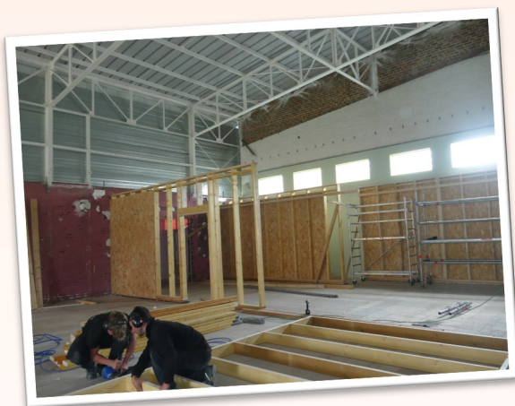
Cloisonnement et isolation des murs de la salle annexe.