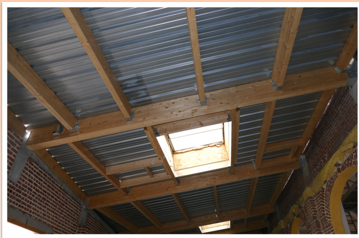
Charpente et couverture de la véranda posées avec création de puits lumineux.

Les travaux de ventilation, de chauffage et la pose des nouvelles menuiseries sont actuellement en cours.