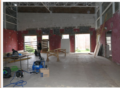
Création d'ouvertures au regard des obligations en matière de sécurité.