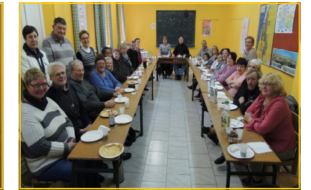
Le secours catholique a organisé un après-midi « crêpes » à l'occasion de la chandeleur.