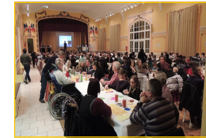
Carton plein pour l'APE des écoles primaire et maternelle à l'occasion du loto du 08 Février 2014.