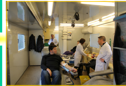
41 volontaires ont donné leur sang dans le car de prélèvement situé sur la place de la République le 27 Janvier dernier.