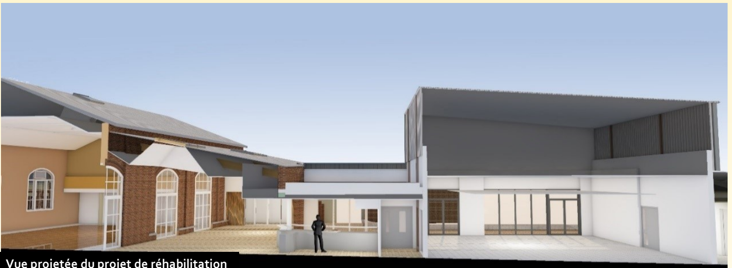
Vue projetée du projet de réhabilitation