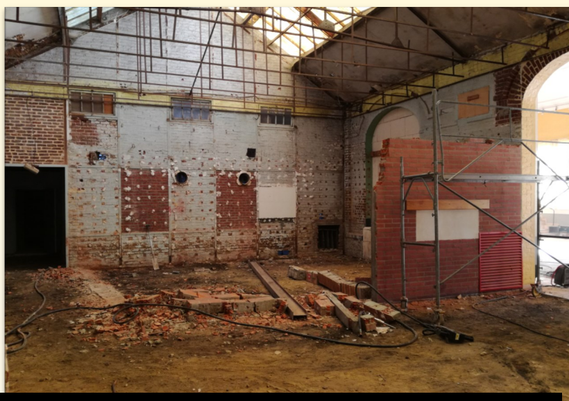
Démontage et démolition de la cuisine

Sont réalisés en ce moment des travaux de démolition et de curage. Toute la partie électrique a été enlevée, les chauffages démontés ainsi que la cuisine.