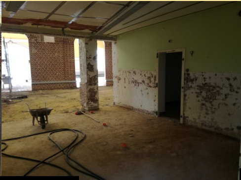
Le curage de l'ancien restaurant scolaire

Dans les prochaines semaines, les travaux de gros-œuvre, le désamiantage extérieur et les ouvrages de charpente seront réalisés.