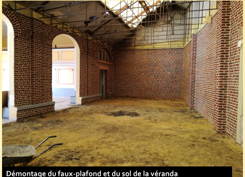
Démontage du faux-plafond et du sol de la véranda

► Véritable cœur battant de la commune, cette « belle et grande dame », aussi majestueuse soit-elle, ne pouvait dignement rester en l'état. C'est ainsi un investissement important mais tellement nécessaire pour projeter vers l'avenir ce bien commun des Avesnoises et des Avesnois.