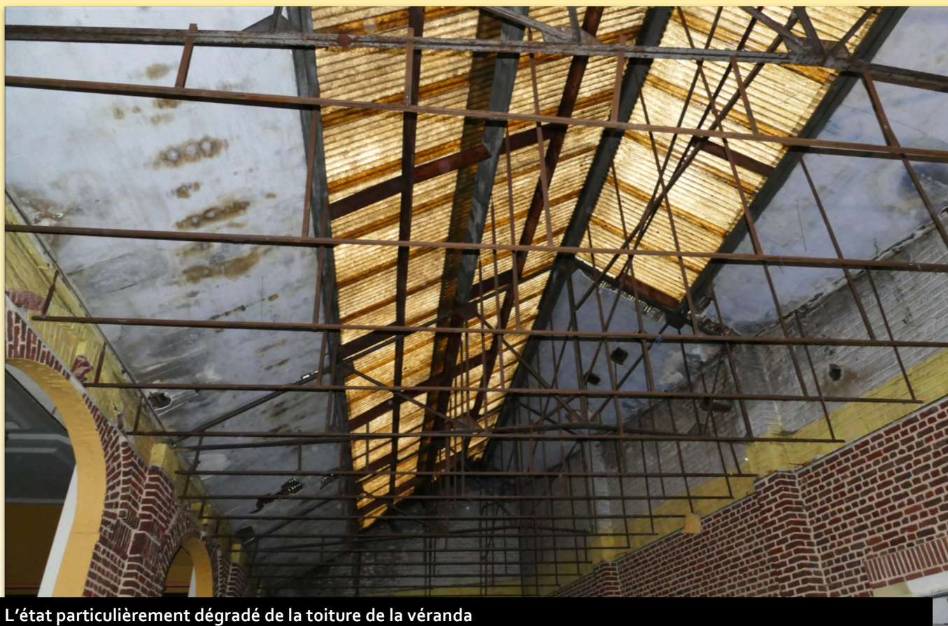
L'état particulièrement dégradé de la toiture de la véranda

La salle des fêtes n'était ni aux normes de sécurité, ni aux normes d'accessibilité, et était un des bâtiments les plus énergivores du Cambrésis. C'est pourquoi la Municipalité a fait le choix de mener des travaux lourds de réhabilitation pour sécuriser la salle. De plus, cette salle appartenant à tous, il s'agit également de permettre à ce que les personnes en situation de handicap puissent y accéder comme tout à chacun. De surcroît, il s'agit de lui donner une dimension plus large avec un espace polyvalent et multifonctions permettant un rayonnement intercommunal.