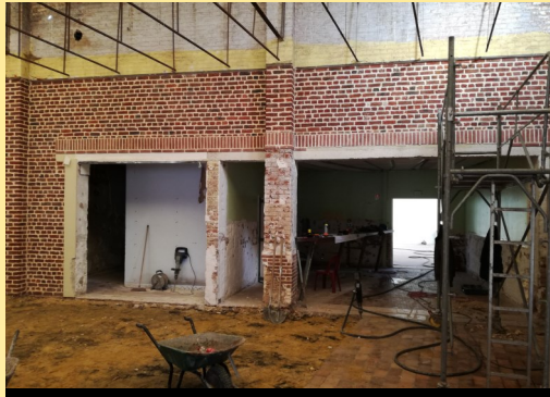
Les travaux au niveau de l'ancien bar