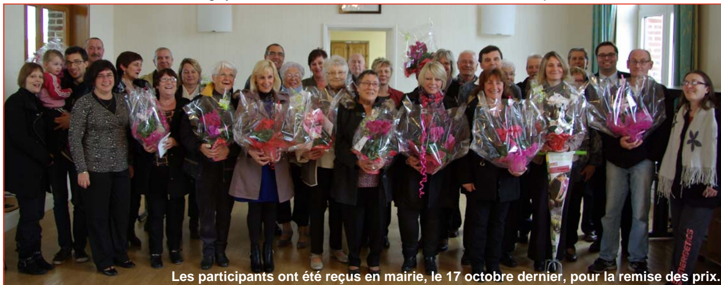
Les participants ont été reçus en mairie, le 17 octobre dernier, pour la remise des prix.