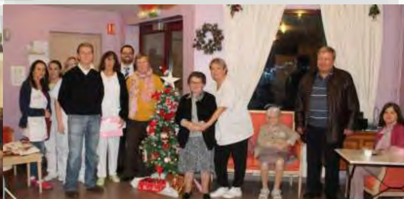
À la résidence « Le Bois d'Avesnes » : Spectacle intergénérationnel avec les enfants de l'accueil de loisirs du mercredi après-midi et remise de cadeaux aux résidents par les membres du Conseil Municipal.

Certaines photographies ont été aimablement transmises par M. César Herbin. Nous le remercions.