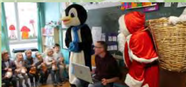
Le Père Noël et le Pingouin ont offert un petit sachet rempli de gourmandises et un livre aux élèves de l'école maternelle.

Parce que les images sont toujours plus parlantes que les mots, retrouvez l'ensemble de ces chaleureux moments de la fin d'année 2017 en photos.