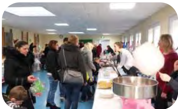
Le marché de Noël des écoles, proposé par l'Association des Parents d'Élèves, s'est déroulé dans la salle de motricité de l'école Danielle Casanova.