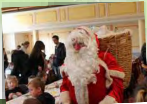
Le Père Noël est venu à la salle des fêtes pour distribuer des bonbons aux enfants.