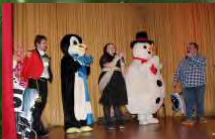
Les enfants ont apprécié le spectacle mélangeant chants, magie et de franches parties de rigolades.