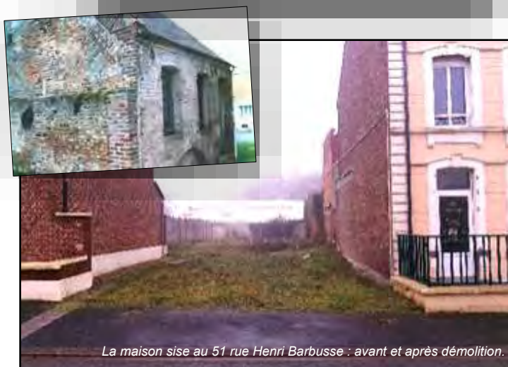
La maison sise au 51 rue Henri Barbusse : avant et après démolition.