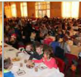
Un succulent goûter a été servi aux élèves de primaire et maternelle.