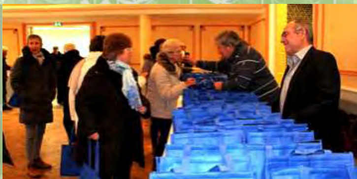
Un goûter de Noël et un colis ont été offerts à nos aînés. Les bénéficiaires du CCAS n'ont pas été oubliés.