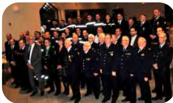
Les Sapeurs-Pompiers de la Caserne « Aubert » se sont réunis pour la traditionnelle fête de la Sainte Barbe.