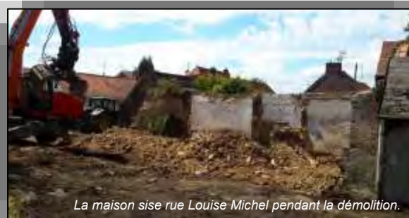
La maison sise rue Louise Michel pendant la démolition.

Vous l'aurez compris, la Municipalité est particulièrement investie et mobilisée pour que votre ville soit toujours plus accueillante et le cadre de vie toujours plus agréable.