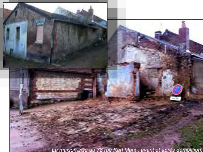
La maison sise au 78 rue Karl Marx : avant et après démolition.

C'est ainsi que certains biens ont été démolis ou le seront prochainement. Toutefois, si beaucoup a été fait, beaucoup reste à faire.