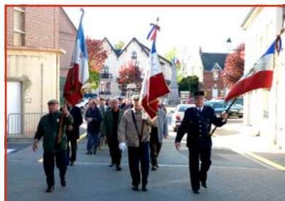
Défilé, dépôt de gerbes et discours à l'occasion de la Commémoration de la Déportation le 28 avril dernier.