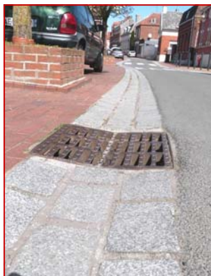
Comme chaque année, Noréade a procédé au nettoyage des canalisations.