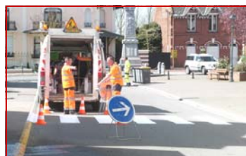
Des travaux de peinture ont été réalisés par la 4C sur nos voiries.