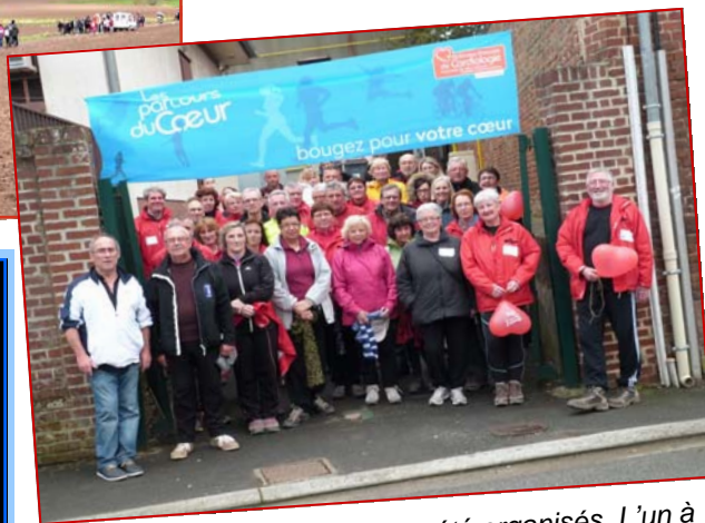
Deux parcours du cœur ont été organisés. L'un à destination des enfants de l'école élémentaire Joliot-Curie. L'autre, ouvert à l'ensemble de la population.