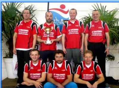
Félicitations au Baby Foot Avesnois qui a participé les 21 et 22 mars derniers au Championnat de France à Evry et qui a terminé vice-champion de France !