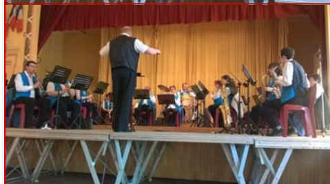
Les prestations de l'Harmonie Batterie Municipale et du Groupe Arpège ont ravi le public présent à l'occasion du traditionnel concert de Pâques.