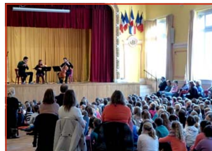
Un concert flûte/alto/violoncelle de l'orchestre « Les Siècles », organisé par l'association Action et donné aux élèves de l'école élémentaire Joliot-Curie. Ceux-ci ont beaucoup apprécié la musique classique.