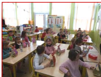
Distribution de chocolats de Pâques aux enfants de l'école maternelle Danielle Casanova par les élus.