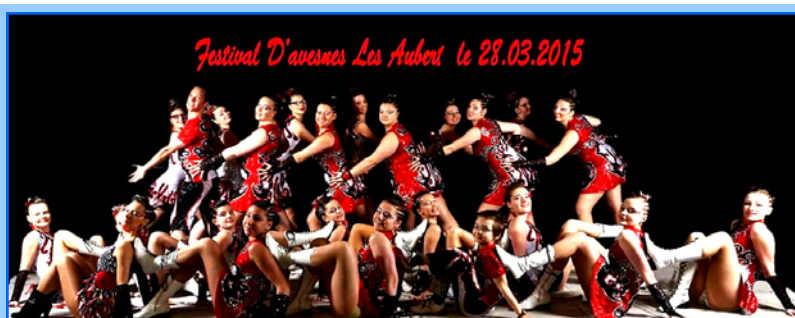
Vif succès pour le 26 ème festival qui a rassemblé près de 600 majorettes du Nord-Pas-de-Calais et plus de 350 personnes dans le public.