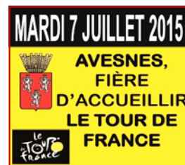
Installation de panneaux pour annoncer le passage du Tour de France dans notre commune le 7 Juillet prochain et ainsi exprimer toute notre fierté.