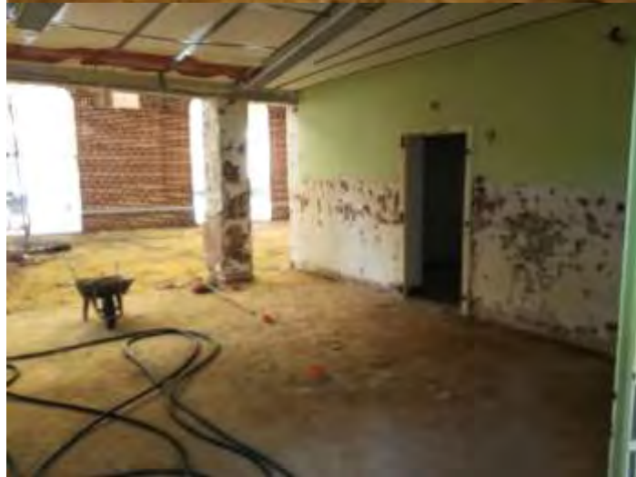
Salle des fêtes. Les travaux de réhabilitation ont commencé.